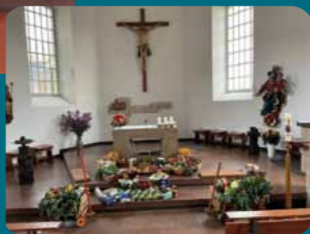
Erntedank in Hochheim