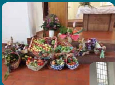
Erntedank in Vieselbach