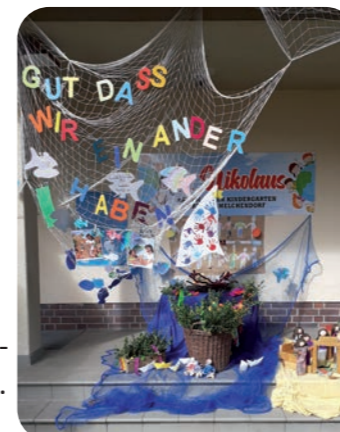
Palmweihe im Kindergarten St. Nikolaus

Für Palmsonntag können Buchsbaum oder Weidenzweige ab dem 1. April im Windfang der Kirche in Hochheim und auf dem Pfarrhof in Melchendorf abgegeben werden. Körbe stehen bereit. Die Kindergärten und alle Gemeindemitglieder sind eingeladen Palmbuschen zu gestalten. Diese werden am Palmsonntag gesegnet und können ab Palmsonntag aus den Kirchen mitgenommen werden.